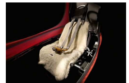
Innenraum mit verstellbarem Sitz & 5-Punkt-Gurt