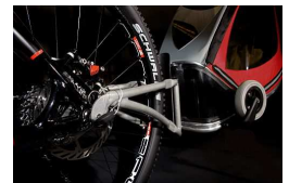
Die Deichsel-Kupplung passt auch zum FollowMe und FollowBox