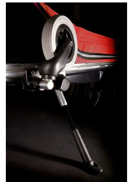
Ständer mit Gasdruckzylinder und optionalem Buggy-Kit