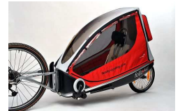
Sportlich, sicher, Komfortabel: FollowKid