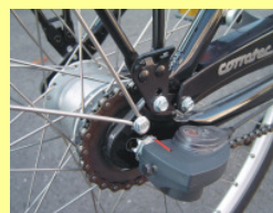
Typ C (gilt für beide Abbildungen) Nabenschaltung mit Klick-Box (z.B. Sram) oder Schaltzug durch die Radachse