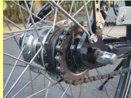
Typ B Ketten- oder Nabenschaltung mit Vollachse M10x1 / 3/8 Shimano