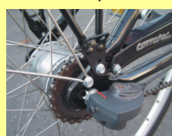
Typ C (gilt für beide Abbildungen) Nabenschaltung mit Klick-Box (z.B. Sram) oder Schaltzug durch die Radachse