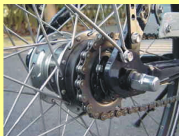
Typ B Ketten- oder Nabenschaltung mit Vollachse M10x1 / 3/8 Shimano