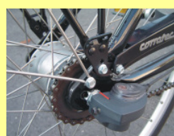
Type C (les 2 photos ci-dessus)

Changement de vitesse par chaîne ou à moyeu avec essieu plein M10x1 / 3/8.