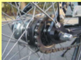
Typ B Ketten- oder Nabenschaltung mit Vollachse M10x1 / 3/8 Shimano