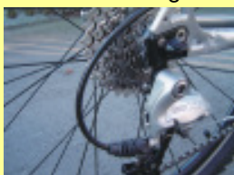
Typ A (Standard) Kettenschaltung mit Hohlachse (Schnellspanner)

Prüfen Sie bitte für die Bestellung Ihren Schaltungstyp, resp. die Art der Achse am Elternfahrrad, damit wir Ihnen den richtigen Montagesatz zusenden können. Kreuzen Sie den entsprechenden Schaltungstyp an!