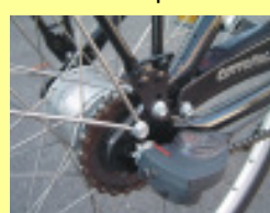
Typ C (gilt für beide Abbildungen) Nabenschaltung mit Klick-Box (z.B. Sram) oder Schaltzug durch die Radachse